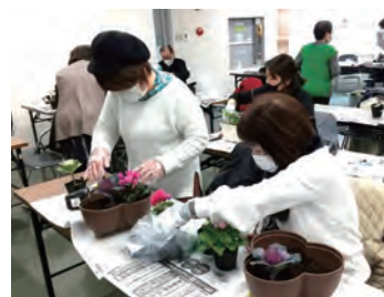
主婦の会 社会見学