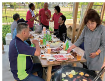
支部バーベキュー