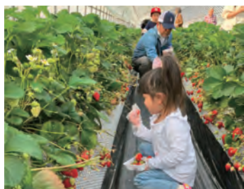
支部レクリエーション

組合ではレクリエーションやスポーツなど組合員同士の交流を行っています。青年部や主婦の会も独自に活動を進めています。